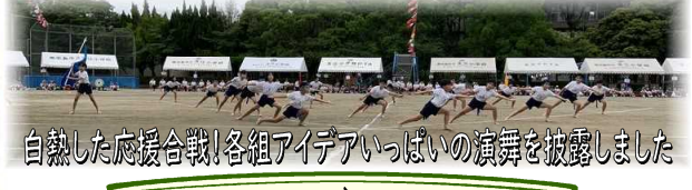
白熱した応援合戦!各組アイデアいっぱいの演舞を披露しました