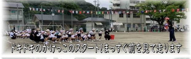
ドキドキのかけっこのスタート!まっすぐ前を見て走ります