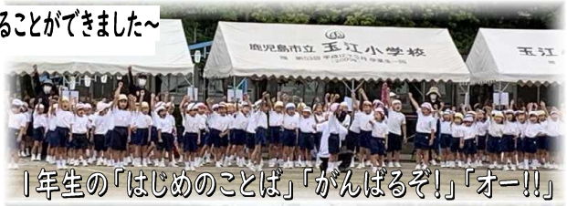
1年生の「はじめのことば」「がんばるぞ!」「オー!!」