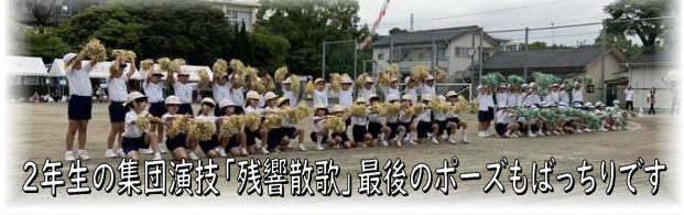
2年生の集団演技「残響散歌」最後のポーズもばっちりです