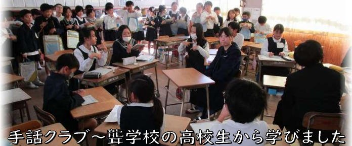
手話クラブ~聾学校の高校生から学びました

3年生は各学級ごとに順番を決めて、45分間ですべてのクラブを見て回り、それぞれのクラブが、どんなことを、どのように活動しているのかを確かめました。4年生になってからの活動が待ち遠しい様子でした。