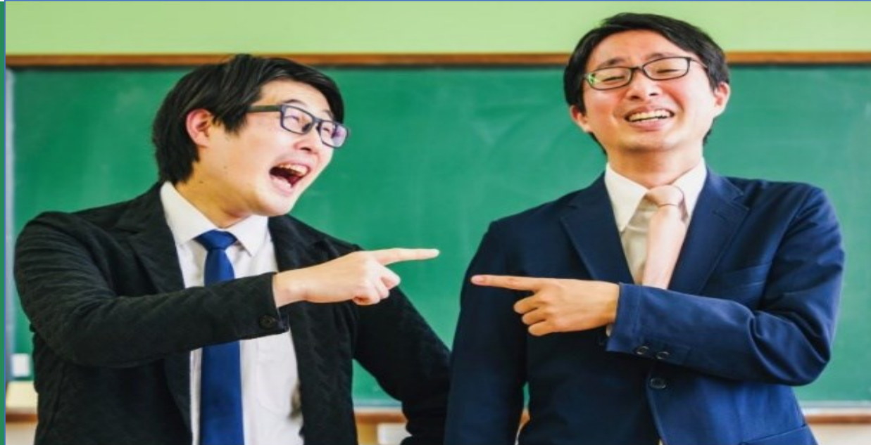
オシエルズ（お笑いコンビ）