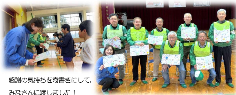
感謝の気持ちを寄せ書きにして、みなさんに渡しました！

見守っている方からも、あいさつができていて素晴らしいですと褒めていただき、子どもたちも喜んでいました。これからも、東昌小学校の子ども達が、安心・安全に登下校できますよう、よろしく願いいたします。