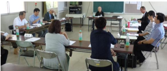
【第1回学校運営協議会協議の様子】

第1回の学校運営協議会においても各委員から幅広い意見が寄せられました。協議の結果を生かしながら今後も「地域の学校」として教育活動の充実を図っていきたくと考えます。