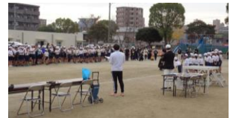
【写真：閉会式、成績発表】