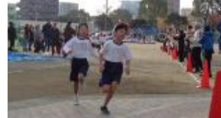
【写真：正門付近の様子】

学校の外周を走る持久走大会が実施できたのは、保体部やボランティアの皆様のご協力のおかげです。今年も事故なく無事競技を終えることができました。