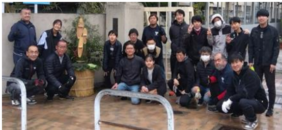
【写真 正門で門松を囲んで撮影】