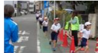
【写真：多くの見守り】