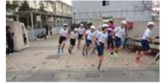
【写真：内周から外周ルへ】