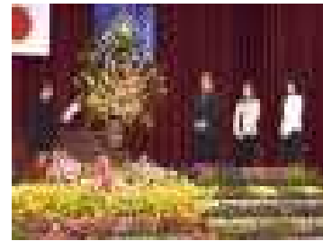
新しい先生をお迎えして(新任式)