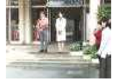
お世話になりました(離任・出発式)