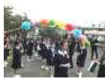
卒業生11名が新たなステージへ(卒業式)