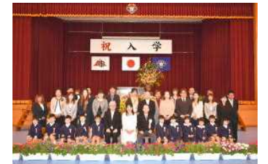
ピッカピカの1年生(入学式)