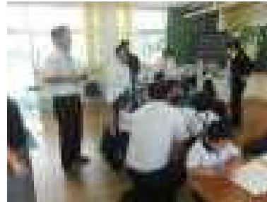
実践にもとづく研修～2年国語研究授業～