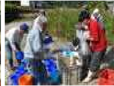
大きくなってね～思川漁協うなぎ放流体験～