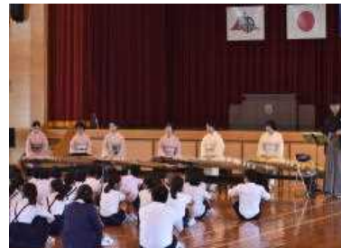
和楽器の美しい音色が響く～芸術鑑賞会～