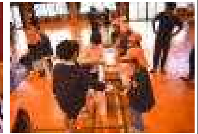
楽しいイベントが盛りだくさん～1・2年秋祭り～