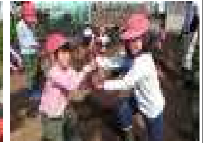
甘くて大きな芋が育ったよ～1・2年生活科～