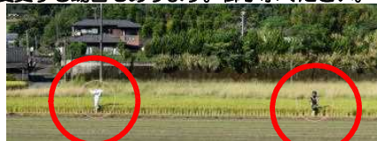
5年生がかかしを作成しました

上記の記事の詳しい内容や南日本新聞に掲載された本校の子供達の作品を、吉田小学校のブログに載せてあります。また、学校行事や日々の子供達の頑張りのブログを毎日更新しています。右のQRコードか、吉田小学校ホームページからぜひご覧ください。