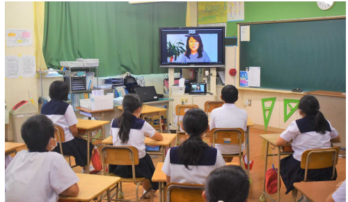
がん教育オンライン授業の様子