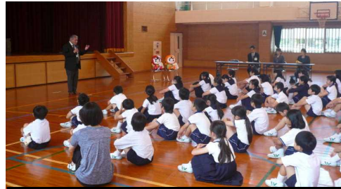
「人権の花運動」開会式の様子

「生まれながらに人として幸せに生きるための必要は権利を『人権』と言います。その人権を守るためにこれから1年を通して学んでいきましょう。その象徴となるひまわりの花も大切に育て、人権を大切にしていこうという思いが詰まった種を次の人たちへとつないでいきましょう。」とお話がありました。