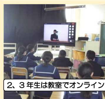
2、3年生は教室でオンライン