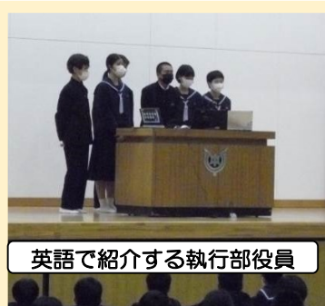
英語で紹介する執行部役員

4月12日(火)の4校時に生徒会オリエンテーションを、5校時に部活動オリエンテーションを行いました。今年、新型コロナウイルス感染症対策のため、1年生全員を体育館に入れ、2、3年生は教室で、体育館からの生中継をオンラインで視聴するという形態で実施しました。生徒会オリエンテーションでは、生徒会役員が英語を交えて、学校生活や生徒会について紹介をしました。1年生は早く学校生活に慣れましょう。2、3年生はもう一度初心に戻って確認を行い、学校生活を充実させましょう。部活動オリエンテーションでは、各部活動で使う道具やボール、楽器、ユニフォーム、シューズなどを提示しながら、各部活動の魅力をアピールしました。どの部活動も新入部員がたくさん入部するといいですね。