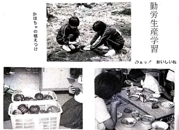
勤労生産学習の様子（創立5周年記念誌から）

開校当時のカラー階段の様子です。階段の上には、桜の木もありません。校訓にも「勤労」とあるとおり、開校当時は勤労生産学習に励んでいたようです。