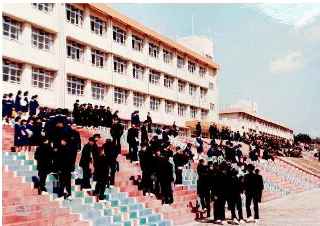
昭和58年4月6日開校式の日カラー階段