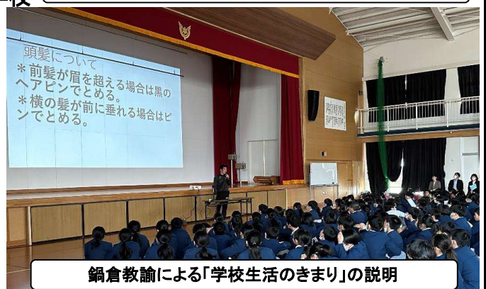
鍋倉教諭による「学校生活のきまり」の説明