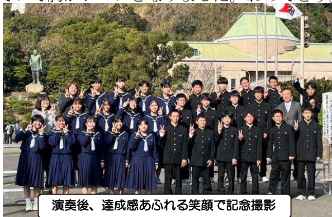
演奏後、達成感あふれる笑顔で記念撮影

令和6年1月20日(土)に宝山ホール(県文化センター)で行われた、第57回県中学校音楽コンクール「春の祭典」に 2年4組 が出場し、見事 金賞 を受賞しました。当日は、風邪などで6人が欠席し、どうなることかと思いましたが、演奏曲「心つないで」の曲名どおり、クラス全員の心をつないで、歌詞に自分たちの思いを重ねて切々と歌い上げました。審査員の講評には、「とても心やさしい歌声に安心感を覚えました」「女声のソプラノの頭声の美しさは特筆ものです」「言葉がはっきりとしていて全体のバランスも良いと思います」「詞がよく伝わるていねいな発声と歌い方、とてもすばらしい。」など賛辞の言葉が並びました。聴いていて胸がジーンとなりました。おめでとう。