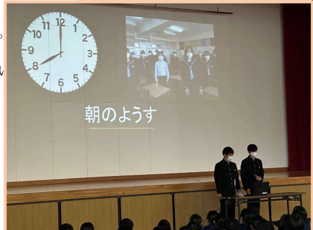
中学校の生活について説明する生徒会執行部の生徒