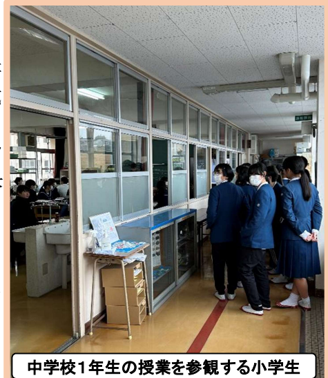
中学校1年生の授業を参観する小学生

最後は、教頭からの保護者へのお話などが行われ、1時間を越える会でしたが、子供たちも集中して話を聴いてくれました。まだまだ小学生としての日々は残っていますのでしっかりと力を着けて、満開の桜の下、入学してくることを今から楽しみに待っています。