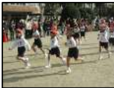
【全力で走る子供たち】