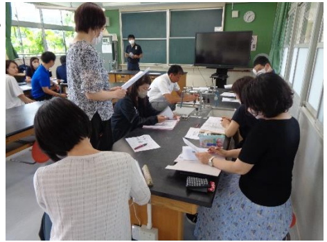
小中合同職員研修の様子