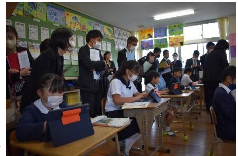
研究授業（3年国語）の様子